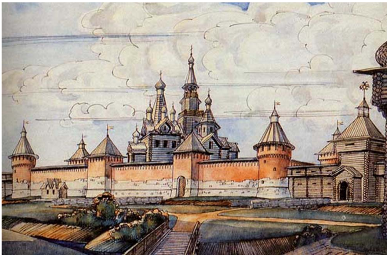
Реконструкция Тульского кремля (XVI в.)