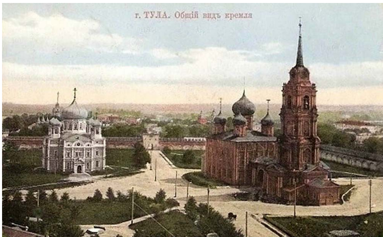
Тульский кремль в начале XX в.

В 1784 г. по повелению императрицы Екатерины II в Тульском кремле был произведен капитальный ремонт. При этом, к сожалению, не ставилась цель сохранить первоначальный вид крепости, поэтому современный Тульский кремль сильно отличается от первоначального.